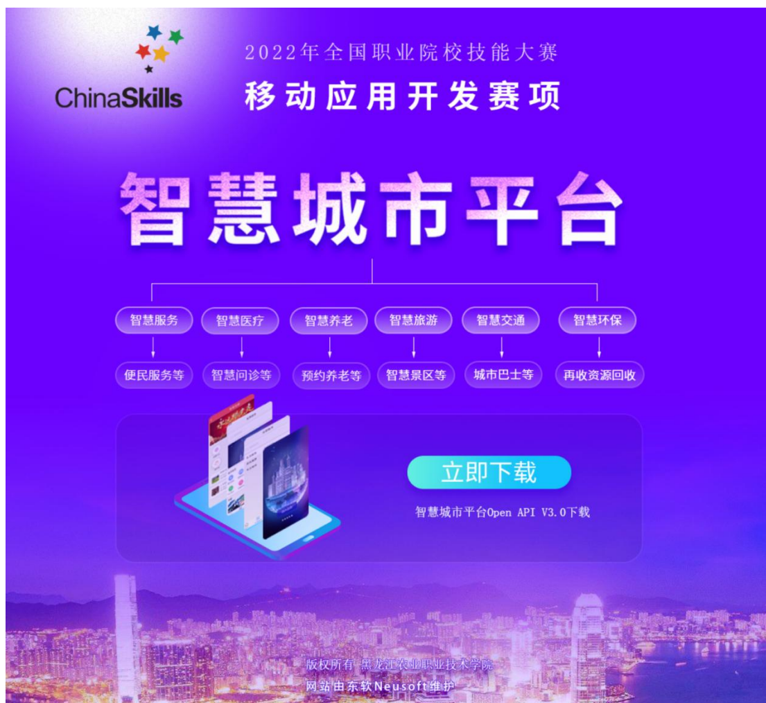
图 1 智慧城市后台

智慧城市后台服务数据，请访问服务器（ http://124.93.196.45:10001/ ）下载智慧城市平台 Open API 文档，并进行数据通讯。