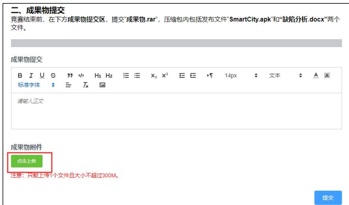
图 3 成果物上传界面