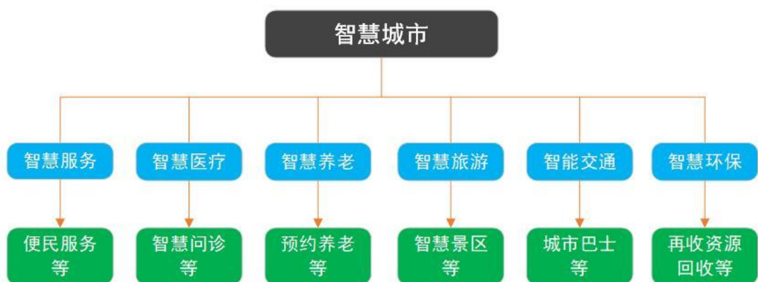
图 1 智慧城市系统架构

智慧城市是指利用新一代信息技术，以整合、系统的方式管理城市运行体系，让城市中各个功能彼此协调运作，为城市中的企业提供优质的发展空间，为市民提供更高的生活品质，让城市成为适合人全面发展的城市，涵盖了智慧政务、智慧环保、智慧安防、智慧交通、智慧教育、智慧医疗、智慧生活等数十个场景。